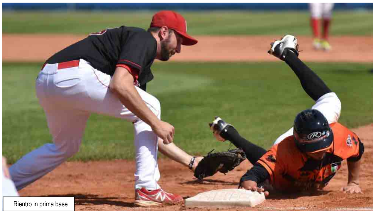
Rientro in prima base