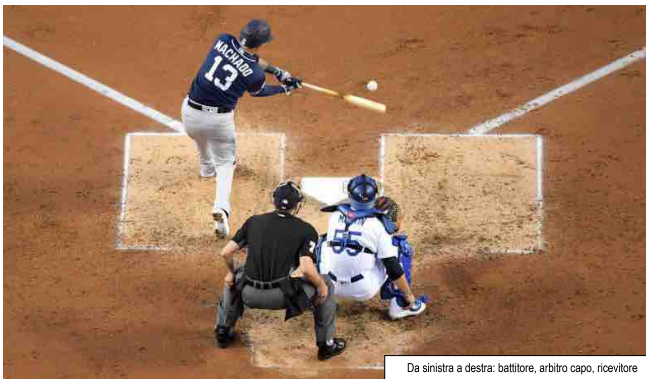
Da sinistra a destra: battitore, arbitro capo, ricevitore