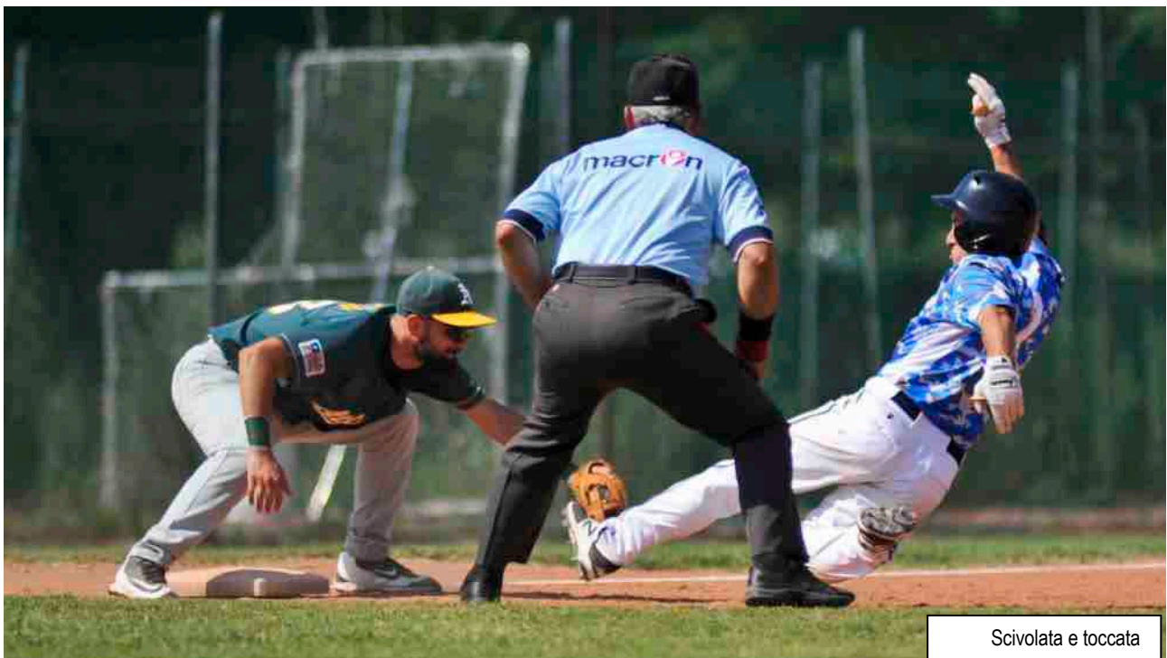
Scivolata e toccata