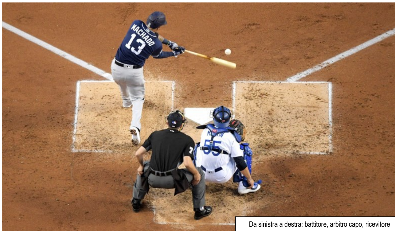
Da sinistra a destra: battitore, arbitro capo, ricevitore